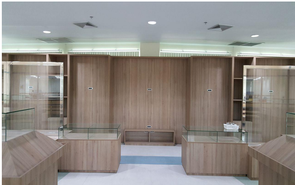
รูปปรับปรุงห้องหอจดหมายเหตุและข้อมูลท้องถิ่น