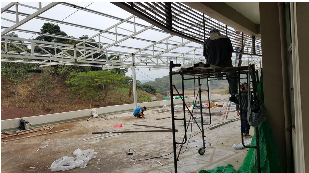
รูปภาพอาคารเดิม ก่อนปรับปรุงเป็นห้องสมุดชุมชน