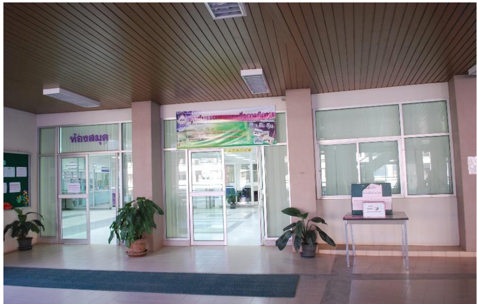
รูปภาพก่อนปรับทางเข้า

2. ศูนย์บรรณสารและสื่อการศึกษาได้มีการปรับปรุงทางเข้า โดยการติดตั้งประตูบานลม เพื่อป้องกันความเย็นออกจากพื้นที่ห้องปรับอากาศ