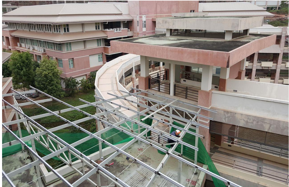
รูปปรับปรุงห้องทำงานหอจดหมายเหตุและข้อมูลท้องถิ่น