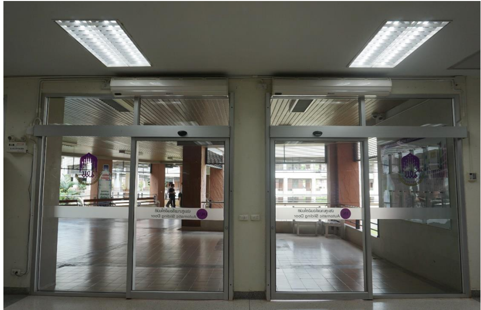
รูปภาพหลังปรับปรุงทางเข้า