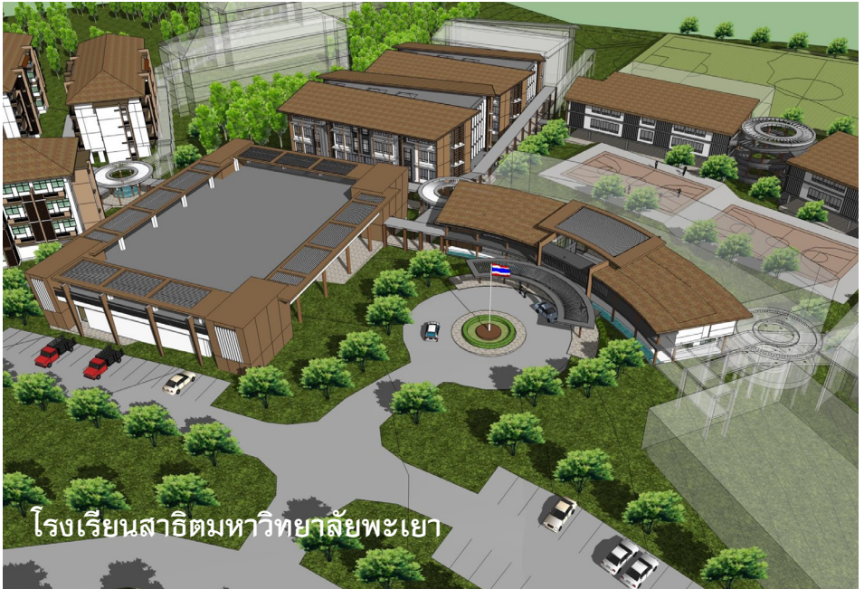
โรงเรียนสาธิตมหาวิทยาลัยพะเยา