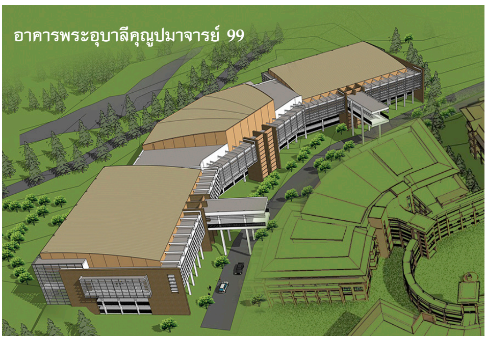
อาคารพระอุบาลีคุณูปมาจารย์ 99