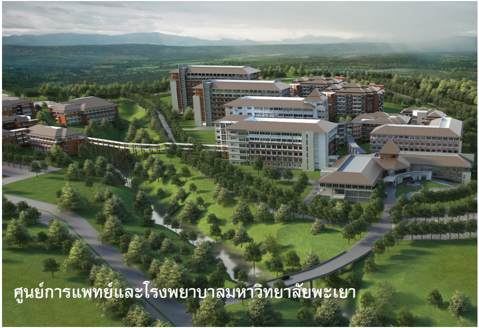
ศูนย์การแพทย์และโรงพยาบาลมหาวิทยาลัยพะเยา