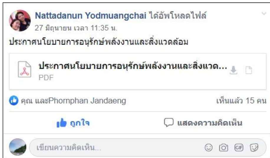
ภาพ 1 ประกาศนโยบายการอนุรักษ์พลังงานและสิ่งแวดล้อมผ่าน Facebook กลุ่มศูนย์บรรณสารฯ

- ประชาสัมพันธ์ผ่าน Facebook กลุ่มศูนย์บรรณสารฯ