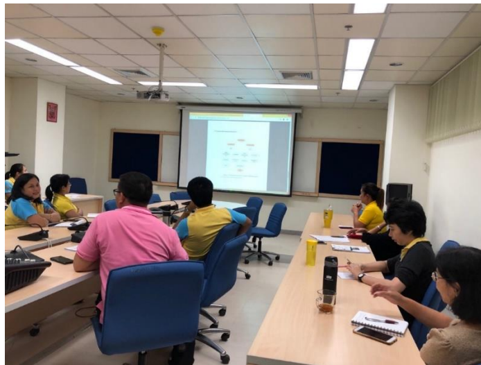
ภาพ 4 การประชุมนโยบายการอนุรักษ์พลังงานและสิ่งแวดล้อม