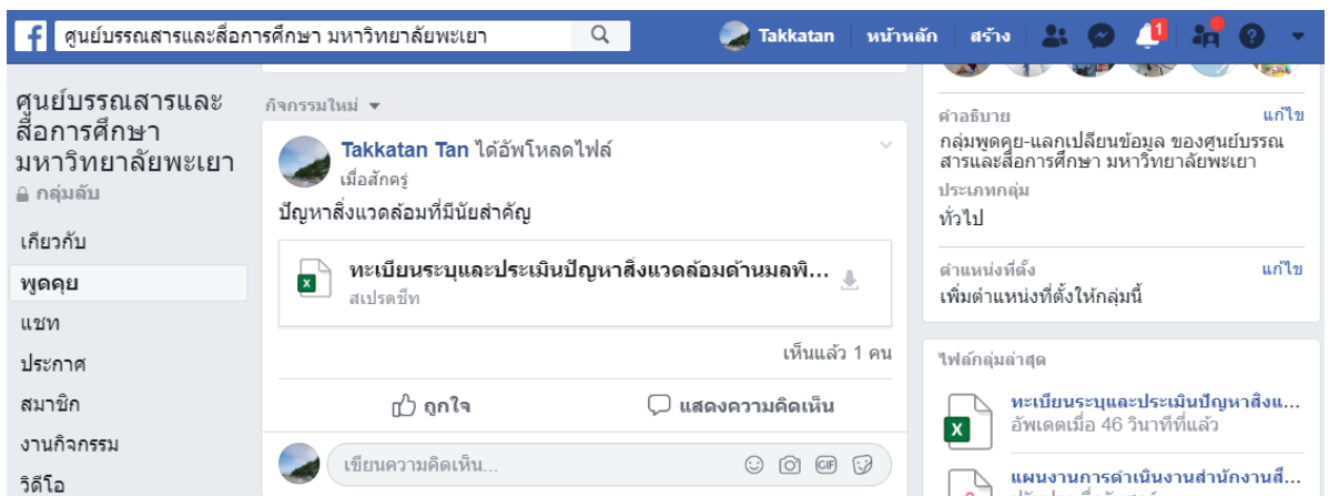
ภาพ 1 การประชาสัมพันธ์ปัญหาสิ่งแวดล้อมที่มีนัยสำคัญผ่าน Facebook กลุ่มของศูนย์บรรณสารฯ