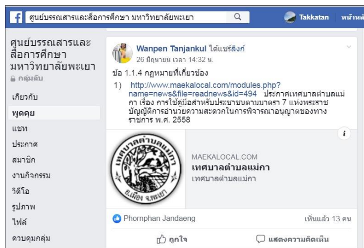
ภาพ 2 ประชาสัมพันธ์ผ่าน Facebook กลุ่มของศูนย์บรรณสารฯ