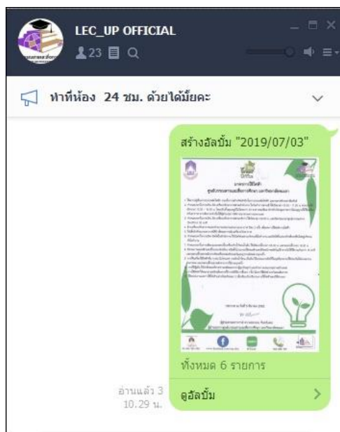
ภาพ 1 ประชาสัมพันธ์ผ่าน Application Line ของศูนย์บรรณสารฯ

- ประชาสัมพันธ์ผ่าน Application Line ของศูนย์บรรณสาร