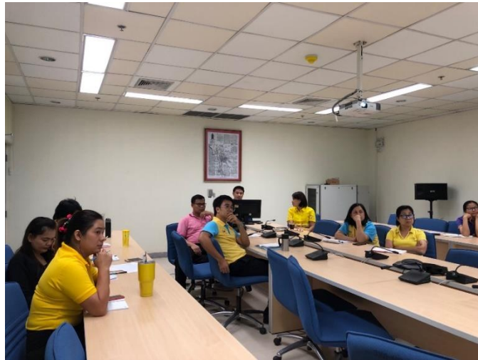
ภาพ 1 การประชุมชี้แจงเป้าหมายและมาตรการจัดการของเสีย

- การประชุมชี้แจงเป้าหมายและมาตรการจัดการของเสีย