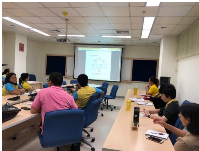
ภาพ 2 การประชุมชี้แจงเป้าหมายและมาตรการจัดการของเสีย