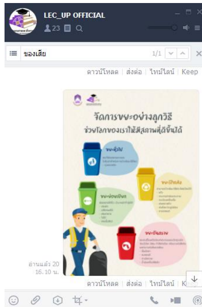
ภาพ 4 ประชาสัมพันธ์ผ่าน Application Line