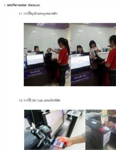
ภาพ 2 การประชาสัมพันธ์ให้ผู้ใช้บริการใช้ถุงผ้าแทนถุงพลาสติกและการใช้ QR Code แทนบัตรมีสติ