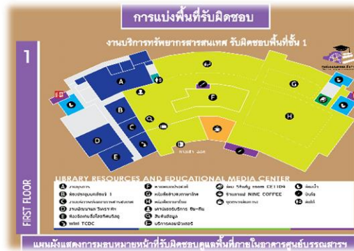
ภาพ 3 การแบ่งพื้นที่รับผิดชอบบริเวณชั้น 1