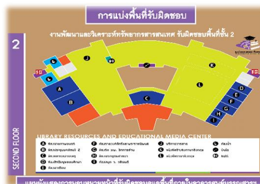
ภาพ 4 การแบ่งพื้นที่รับผิดชอบบริเวณชั้น 2