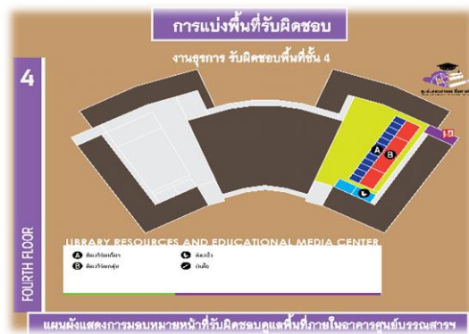
ภาพ 6 การแบ่งพื้นที่รับผิดชอบบริเวณชั้น 4