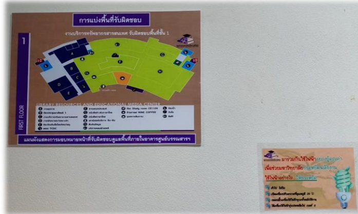
ภาพ 2 ป้ายประชาสัมพันธ์พื้นที่รับผิดชอบ