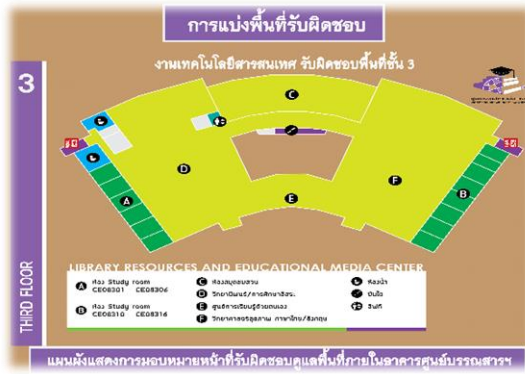
ภาพ 5 การแบ่งพื้นที่รับผิดชอบบริเวณชั้น 3