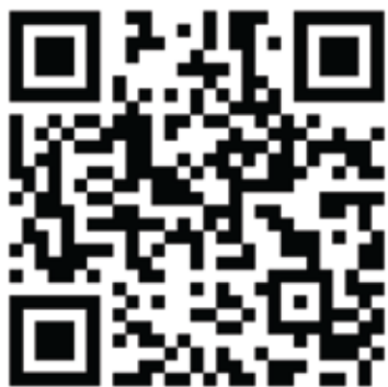
สแกน QR Code เข้าใช้งานฐานข้อมูล ASME Digital Collection

สำนักพิมพ์ ASME เปิดให้ทดลองใช้งานฐานข้อมูล ASME Digital Collection ซึ่งมีหัวข้อให้เลือกค้นหาจำนวนกว่า 30 รายชื่อ (Topic Collections) โดยมีทั้งหนังสืออิเล็กทรอนิกส์ (e-Books) วารสารอิเล็กทรอนิกส์ (e-Journals) รวมถึงเอกสารการประชุม (Conference Proceedings) ซึ่งครอบคลุมสาขาวิชาวิศวกรรมเครื่องกล และสาขาวิชาอื่น ๆ ที่เกี่ยวข้อง ผู้สนใจสามารถเข้าทดลองใช้งานผ่านเว็บไซต์: https://asmedigitalcollection.asme.org/