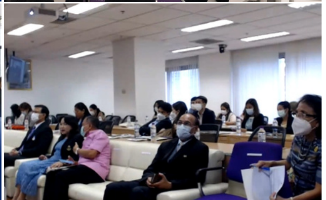
ศูนย์บรรณสารและการเรียนรู้ สถาบันนวัตกรรมการเรียนรู้ให้บริการแนะนำการรัฐสารสนเทศ ภายใต้โครงการสืบค้นข้อมูลและการอ้างอิงข้อมูล คณะนิติศาสตร์ ผ่านระบบ Microsoft Teams