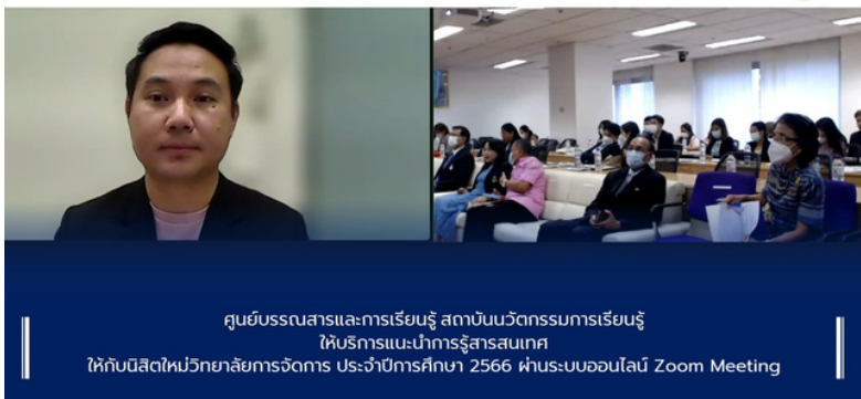
ศูนย์บรรณสารและการเรียนรู้ สถาบันนวัตกรรมการเรียนรู้ ให้บริการแนะนำการรัฐสารสนเทศ ให้กับนิสิตใหม่วิทยาลัยการจัดการ ประจำปีการศึกษา 2566 ผ่านระบบออนไลน์ Zoom Meeting