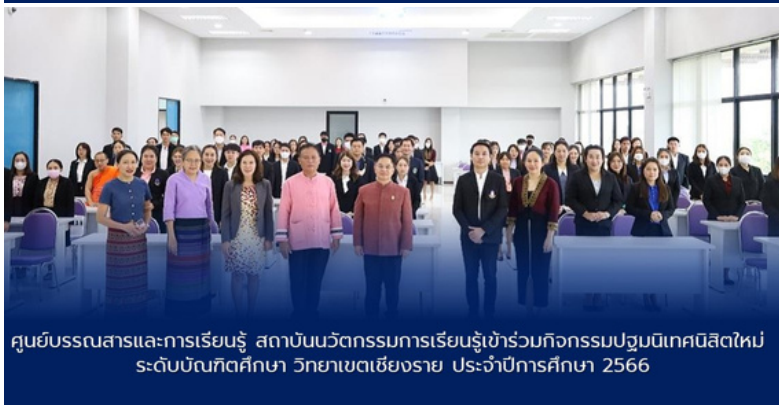
ศูนย์บรรณสารและการเรียนรู้ สถาบันนวัตกรรมการเรียนรู้เข้าร่วมกิจกรรมปฐมนิเทศนิสิตใหม่ ระดับบัณฑิตศึกษา วิทยาเขตเชียงราย ประจำปีการศึกษา 2566